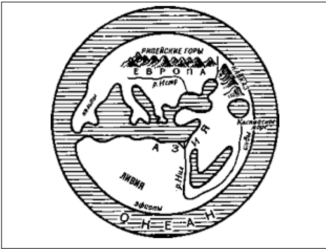
Рис. 3. Карта Земли Гекатея Милетского. [13. с. 210]

никовый период 10000–7500 лет назад), доходивших до современного Киева. В условиях холода и слабого освещения солнцем, из-за постоянных облаков, процесс таяния льдов затянулся на тысячелетия. По мере осушения земли, границы Океана, как и Рипейские горы, в представлении последующих поколений, оказывались все севернее.