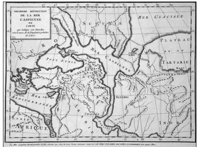
Рис. 2. http://dostoyanieplaneti.ru/2388-kasparalskoie-morie

Откуда возникли истоки представлений древних греков об Океане на севере Каспия? Современные ученые предположили, что территория выше Азовского моря, могла освободиться от ледникового плена и заселиться людьми «только в предбореальное и бореальное время (примерно 10000–7750 лет назад)» [35. с. 6–7]. Еще в первой половине прошлого века, палеограф С. А. Кова-